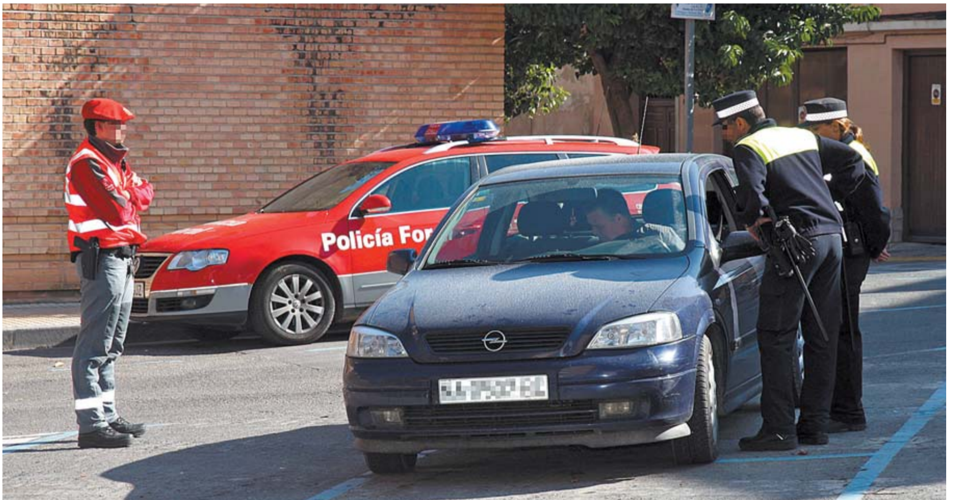
Un Policía Foral y una pareja de policías municipales piden la documentación al conductor de un vehículo en un control policial en Tudela.